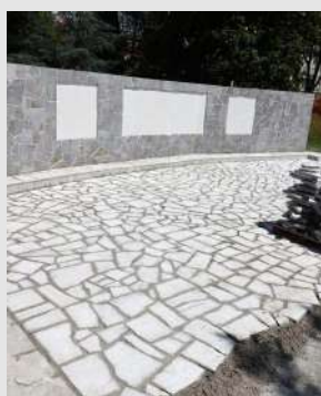
Novi lapidarij