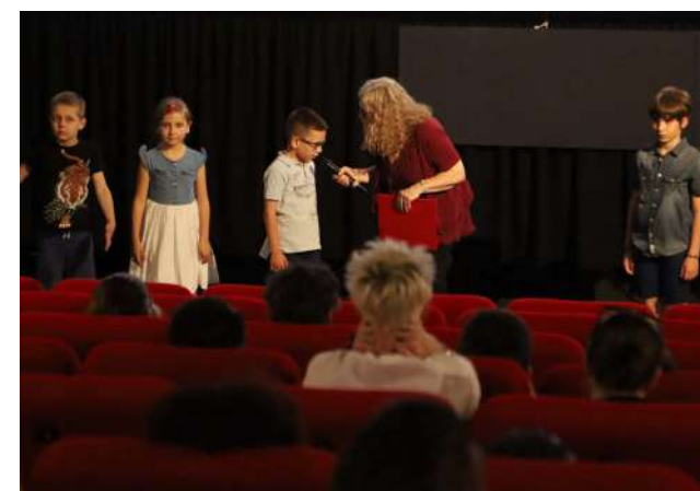
Zaključni večer O izkušnji so spregovorili tudi osnovnošolci KINOATELJE