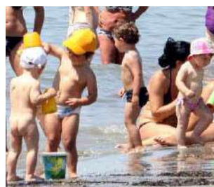
Družine na plaži BONAVENTURA

GRADEŽ Reševalci deželne službe za nujno medicinsko pomoč Sores so včeraj v dopoldanskih urah posredovali na plaži v Gradežu, kjer je dveletni deček tvegala utopitev. Na pomoč je poklicala njegova mama, avstrijska državljanica, ki se je kopala z njim. Dogodek se je pripetil na plaži kampinga Villaggio