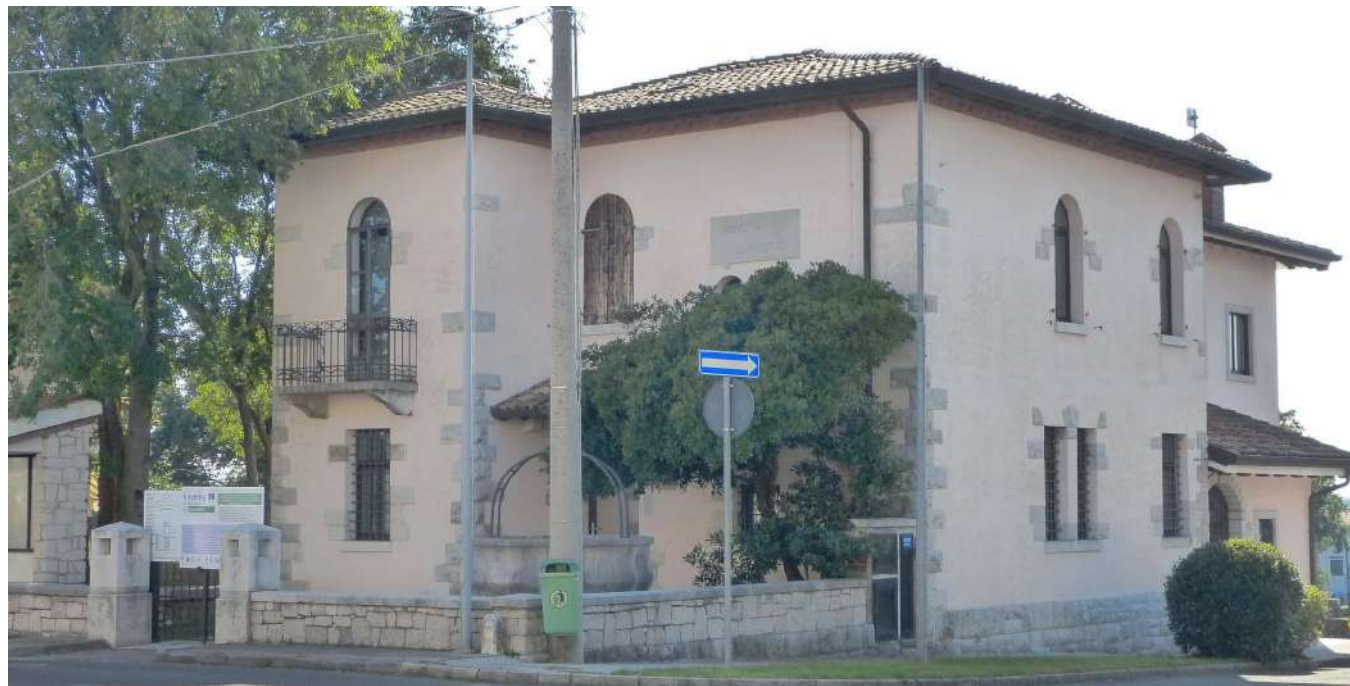
Doberdobsko županstvo Občinski svet je v sredo odobril tudi zaključni račun za lansko leto BUMBACA

Pristojbina Tari Za trgovine z jestvinami ter kulturne in izobraževalne objekte, kot so šole in sedeži društev, se bodo zaradi usklajevanja tarif računov za odvoz odpadkov zvišali za 20 oz. 30 odstotkov