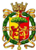
Comune di Ravenna

Con il patrocinio del Comune di Ravenna In collaborazione con