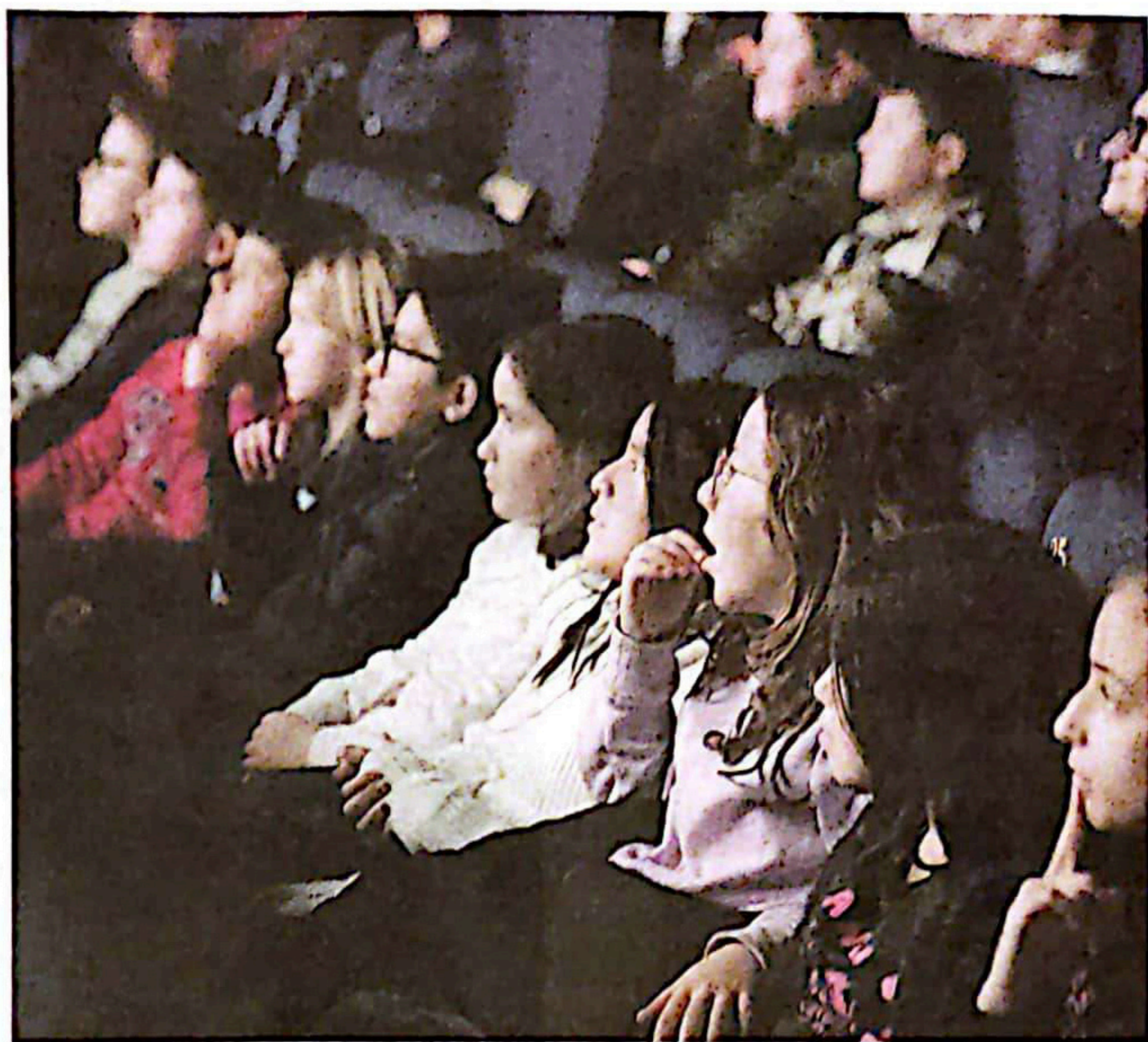
Un momento della presentazione del progetto e un gruppo di studenti al Politeama