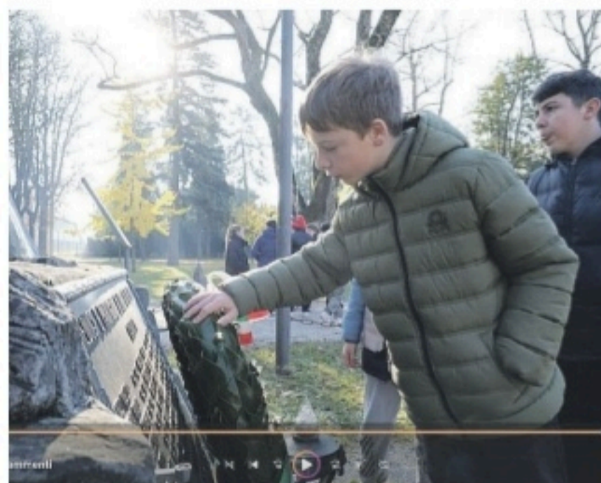
Un fotogramma di un corto F. PADERNI