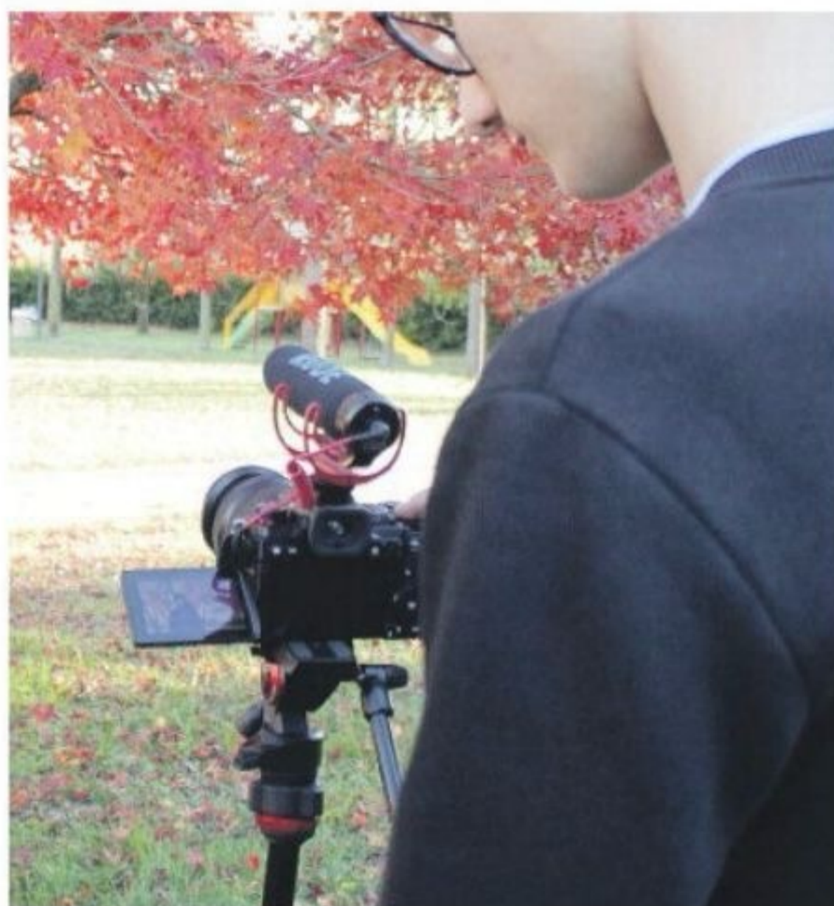
Due momenti delle lezioni con gli studenti alle prese con gli strumenti per le riprese

Scuole di Cortemaggiore e Carpaneto hanno partecipato a un bando su tecniche audiovisive. A gennaio proiezione al Politeama