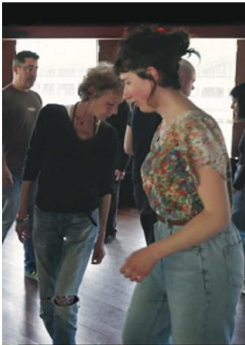
On the Adamant