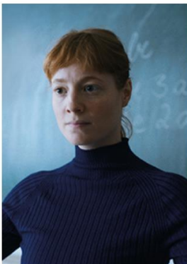
The Teachers' Lounge

Trama: con la sua struttura galleggiante, l'Adamant è un centro di assistenza unico nel suo genere. Nel cuore di Parigi, sulla Senna, accoglie adulti con disturbi mentali aiutandoli a ritrovare un senso di stabilità, a riprendersi e a tenere alto il morale. L'équipe che gestisce il centro è una di quelle che tentano di resistere come meglio possono al deterioramento e alla disumanizzazione della psichiatria. Il film ci invita a salire a bordo dell'Adamant per incontrare i pazienti e il personale che lo animano giorno dopo giorno.