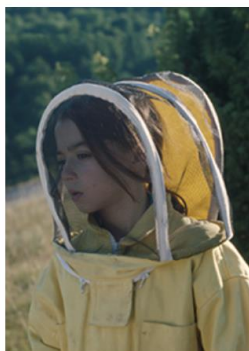
20.000 specie di api

I film selezionati per il progetto il Premio LUX va a scuola 2024 , che verranno distribuiti alle scuole in formato digitale ed in lingua originale con sottotitoli in italiano, sono: